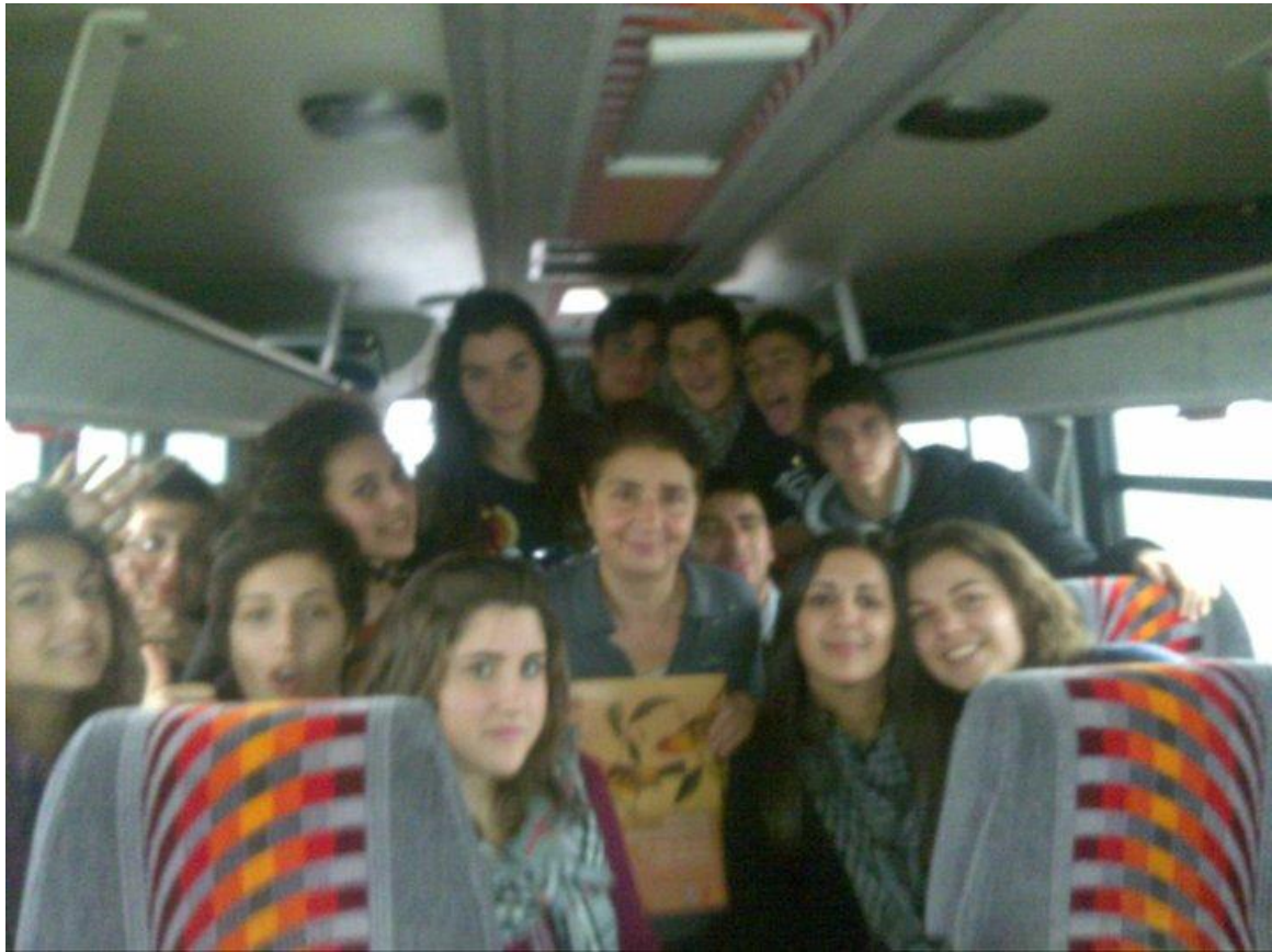
Andando a “è Meeting”, Agnano (NA) 1 dicembre 2010