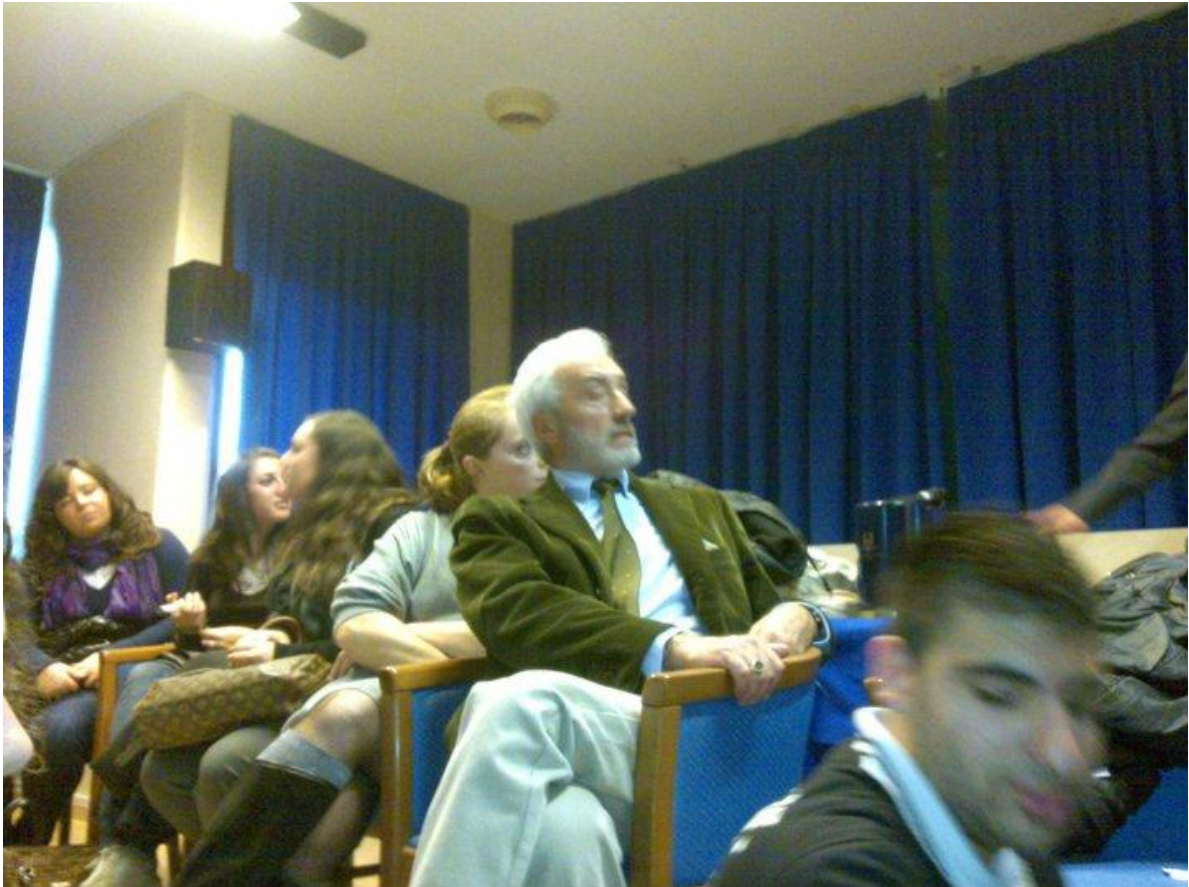
Al Convegno era presente anche Patrizio Rispo, attore di “Un posto al sole”